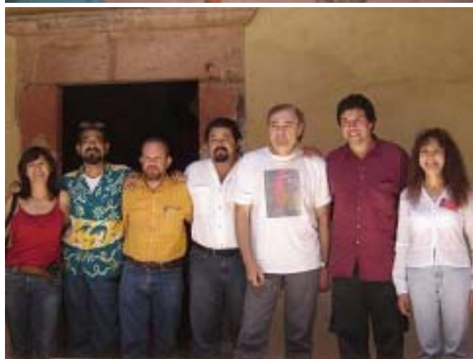
En la página anterior: Foto de Familia de los participantes en el Congreso Arriba: Un momento de Congreso