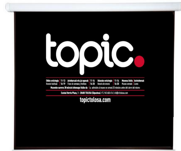
Proiektzioarako pantaila bat