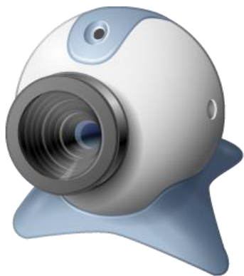
Web kamera bat

Ekintza aurrera eraman ahal izateko beharrezko materiala hurrengoa duzue: